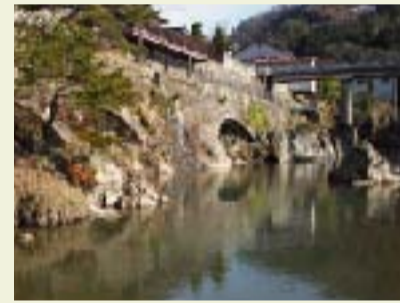
② トロッコ道(旧電気機関車専用軌道) 鉱石輸送のための電車専用道。大正9年(1920年)建築。市川沿いのアーチが美しい。