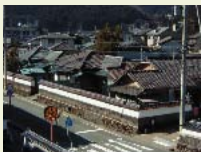
① 甲社宅 明治8年(1875年)に建てられ、日本最古の社宅といわれている。