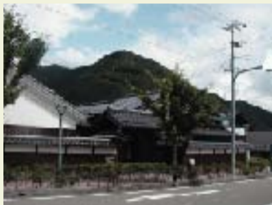
③ 生野書院 材木商の邸宅を改修した郷土資料館。