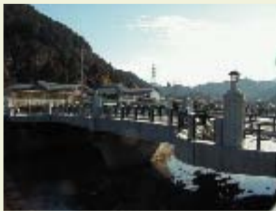
④ 盛明橋 明治8年(1875年)架設。現在の橋は3代目で平成11年(1999年)完成。