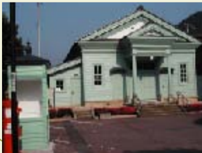
⑤ 1区公民館(旧生野警察署) 明治19年(1886年)建築、当時の大工がフランス人の邸宅であった異人館をまねて建てた擬洋風建築。