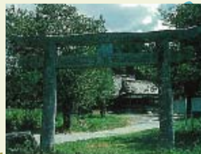
⑥ 岩尾神社と石造鳥居 現存する鳥居は縦高322cm石英粗面岩質の凝灰岩で沓石を用いず、高さの割に幅が広く、柱の内転もないのは古調をのこしたつくりで慶長16年(1611)の銘があります。