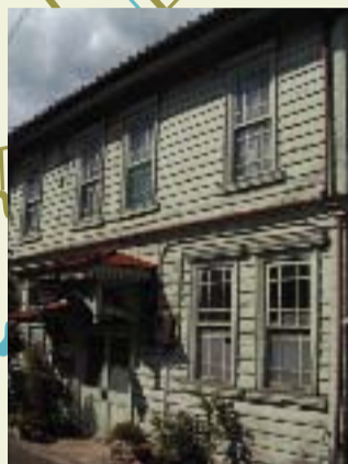
② 旧辻川郵便局 今の福崎郵便局の前身で、大正12年(1923)に三木家によって建てられました。