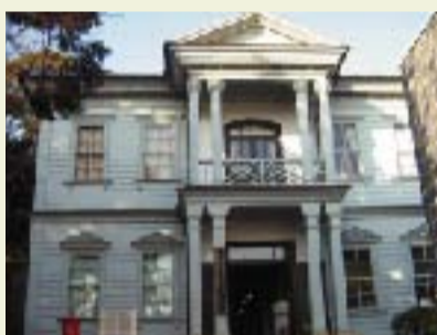
③ 神崎郡歴史民俗資料館 旧神崎郡役所の建物(明治19年(1886))を利用して資料館にしています。(兵庫県指定文化財)