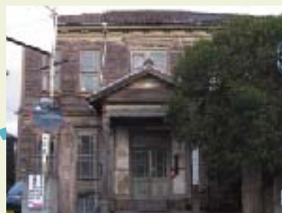
① 旧福崎警察署 この建物は、明治35年(1902)に建てられた警察署の建物です。