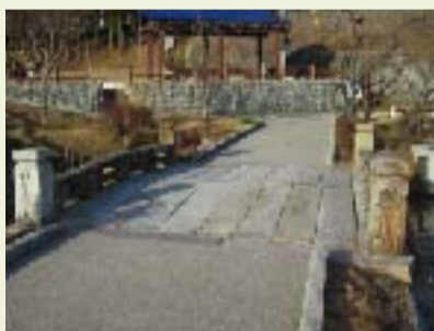
④ 巖橋 柳田國男の『故郷七十年』にも記されている雲津川にかかっていた巖橋。現在は辻川山の南に移設復元されています。