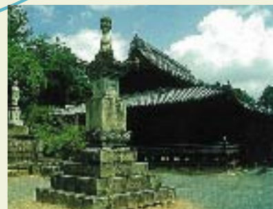
⑤ 神積寺 正暦2年(991)に慶芳上人によって開基された天台宗の古刹。国の重要文化財の薬師如来坐像を本尊とする。智恵の文殊としても有名。